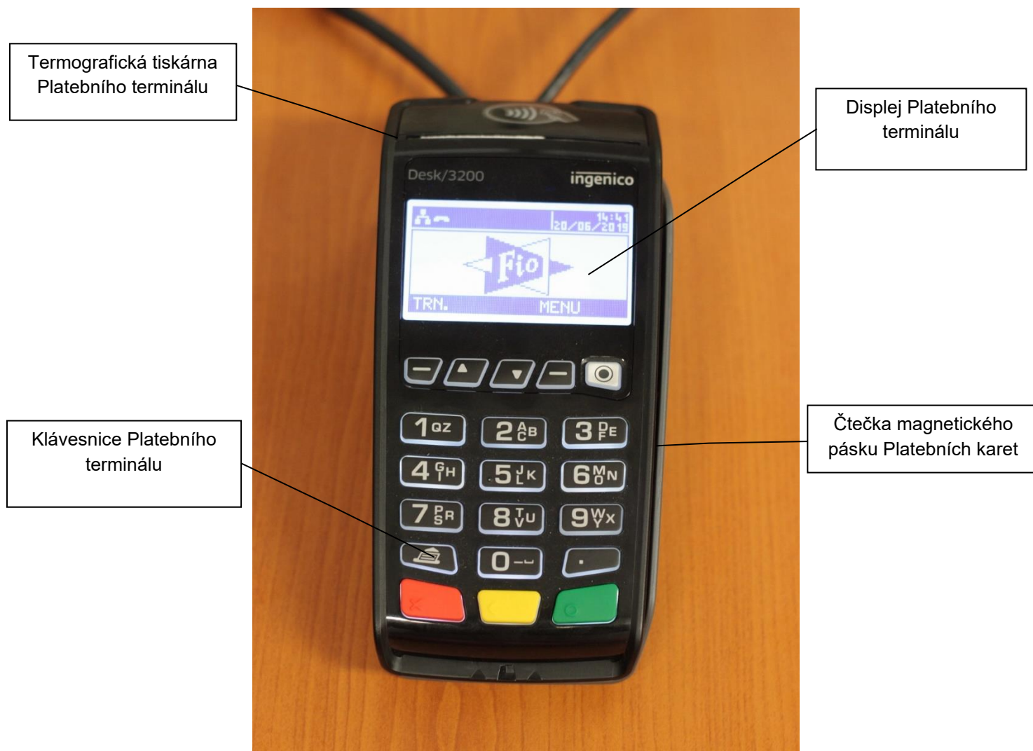
Platební terminál typu Ingenico Desk/3200