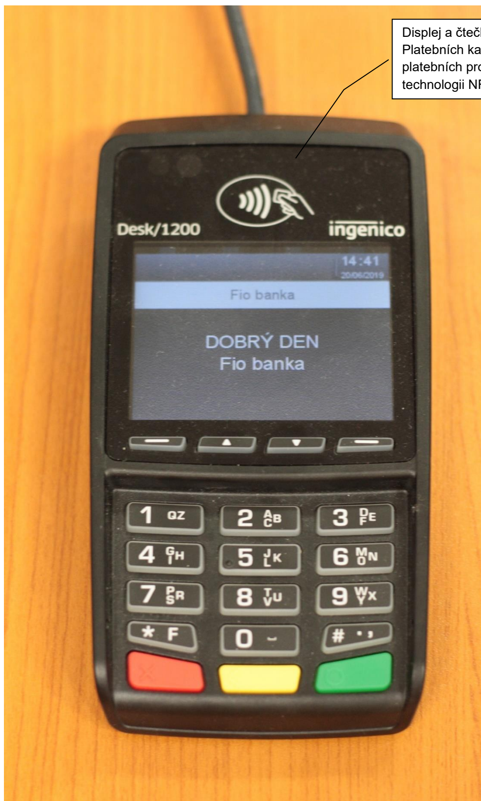
Pin Pad typu Ingenico Desk/1200