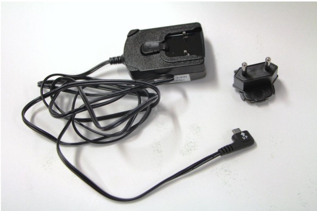
Nejběžněji užívaný konektor napájecí jednotky