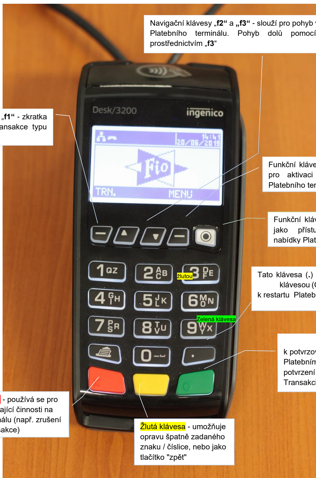
Obsluha Platebního terminálu Ingenico Desk/3200