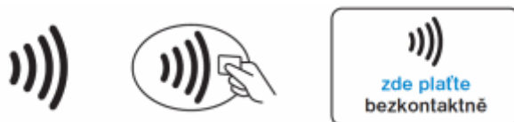
Symbol pro přijímání bezkontaktních Transakcí